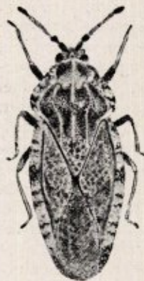
Fig. 3. Tingis cardui L.

Gemakkelijk kunnen we kennismaken met Tingis cardui L. (zie fig. 3). Ondanks de regen